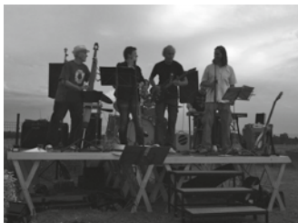
06.01 Bümpliz Boogie Boys