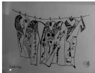
05.23 Ursula Perroud