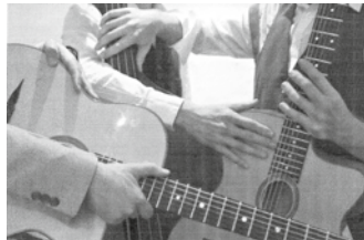
02.15 Le Trio O