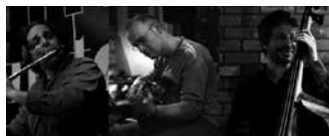
01.26 Colores del Sud