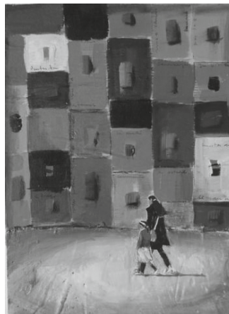
02.23 Art contemporain argentin