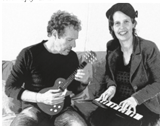
06.22 Blue Groove