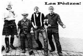
01.25 Les Pèdzes