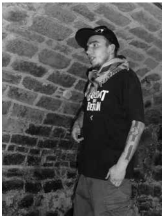
03.21 Slam, l'Echo-Logik