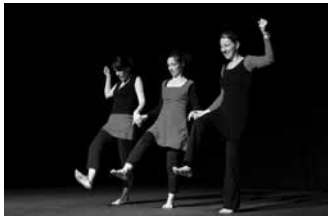
03.09 Peau d'âne