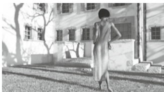
06.22 Infographie 3D, Phil. Gerber