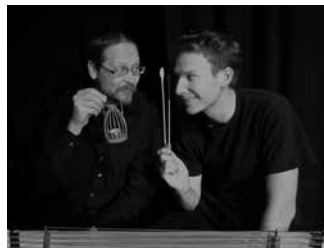
03.23 Sur l'aile de l'elfe