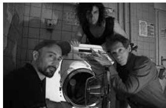
01.19 Trio Tsarpenai