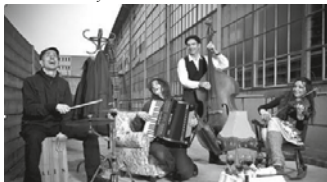
06.21 Zephyr Combo