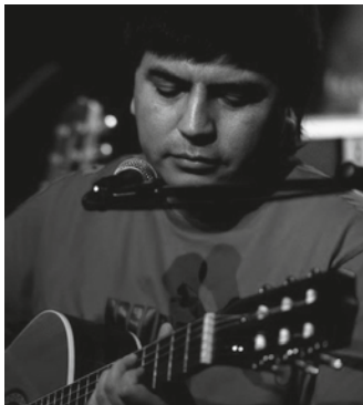
06.08 Esquina Sur