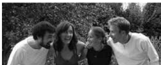
03.02 Boots for Magic