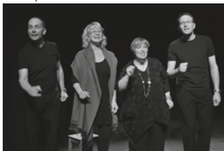
06.14 Le Quatuor laqué