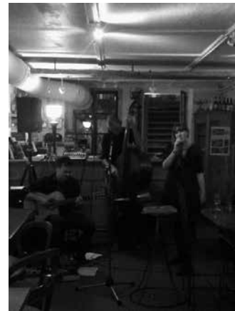
05.25 Sans Claire