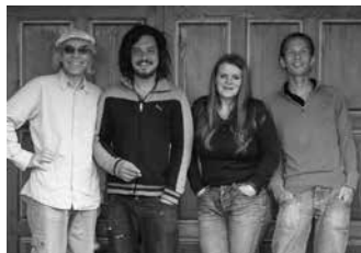
05.17 Agathe Blues Band